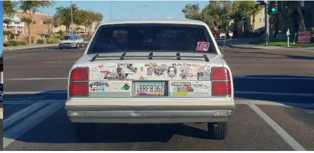
Oldsmobile van een Trump supporter