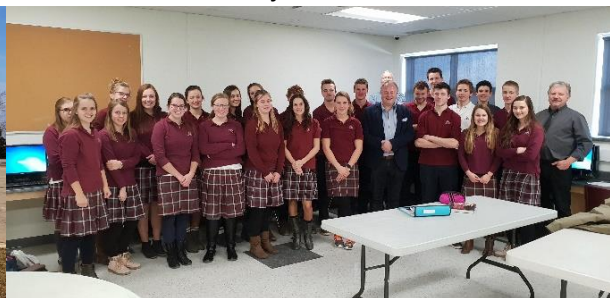
Norwich Class room visit