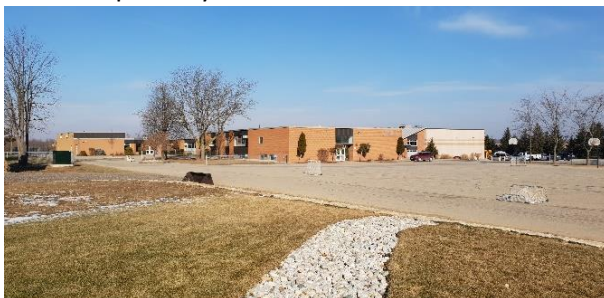
Norwich, Ontario Rehoboth Christian school