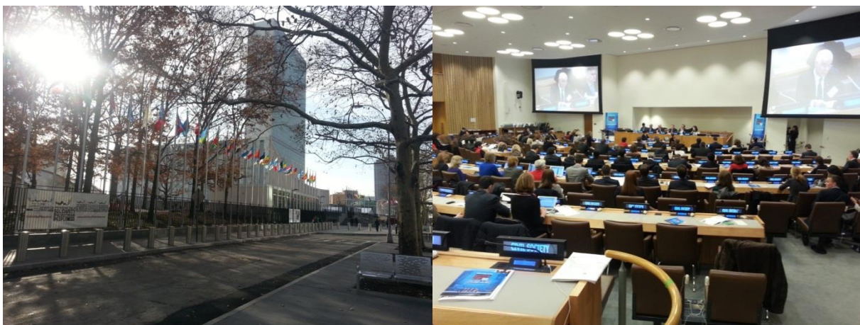
Hoofdgebouw Verenigde Naties, New York

Mogelijk zal TCC deelnemen aan een aantal sessies van de Algemene Vergadering van de VN, die momenteel gehouden wordt in New York ( http://www.un.org/en/ga/ ). Dat zal alleen gebeuren als TCC nuttig gebruik kan maken van zijn bevoegdheden als bij de VN geaccrediteerde organisatie en als de middelen dat toelaten.