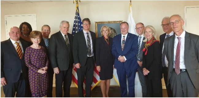
Midden: Betsy DeVos; 5 e van links: John Van Der Brink tijdens een VS-NL Onderwijs-bijeenkomst met secr. Betsy DeVos op 28 oktober 2019

politieke voetbal waarbij Democraten proberen de definities uit te breiden om een liberale ideologie te promoten, terwijl Republikeinen proberen de impact enigszins te beperken.