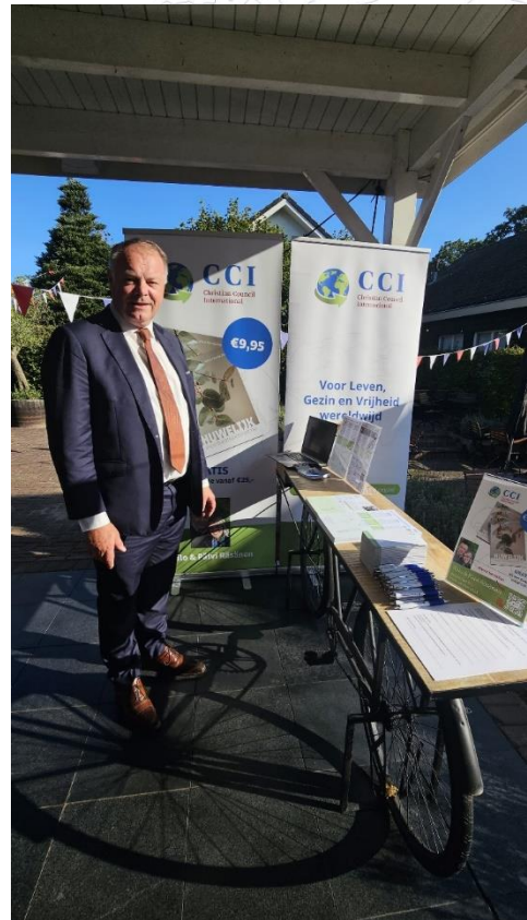
CCI bij Binnenvaart Ontmoetingsdag - 14 september 2024

We hadden mooie ontmoetingen met mensen die betrokken zijn bij de binnenvaart in Woudenberg tijdens hun jaarlijkse ontmoetingsdag.