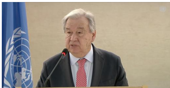
VN Secretaris Generaal António Guterres tijdens zijn openingspeech op de 58ste sessie van de Mensenrechtenraad.

Een afnemend budget en het vertrek van drie landen uit de Raad is niet zomaar iets. Het is dan ook niet vreemd dat deze sessie wat meer terughoudend is. Hoewel de aanvallen op het leven, het gezin en de vrijheid helaas voortduren, werden deze thema's grotendeels verzet naar volgende sessies om politieke debatten te voorkomen.